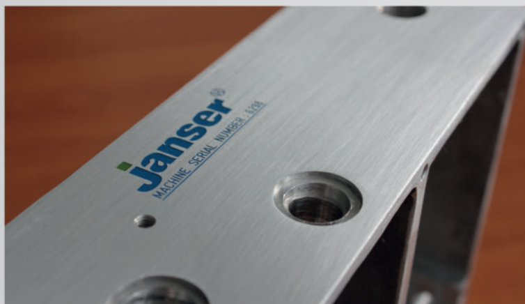
gravure mécanique avec mise en couleur sur aluminium

De nature plane, cylindrique, concave, convexe, en métal, en plastique, de matière organique ou minérale, votre surface est notre champ d'action