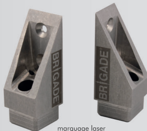
marquage laser sur pièce acier