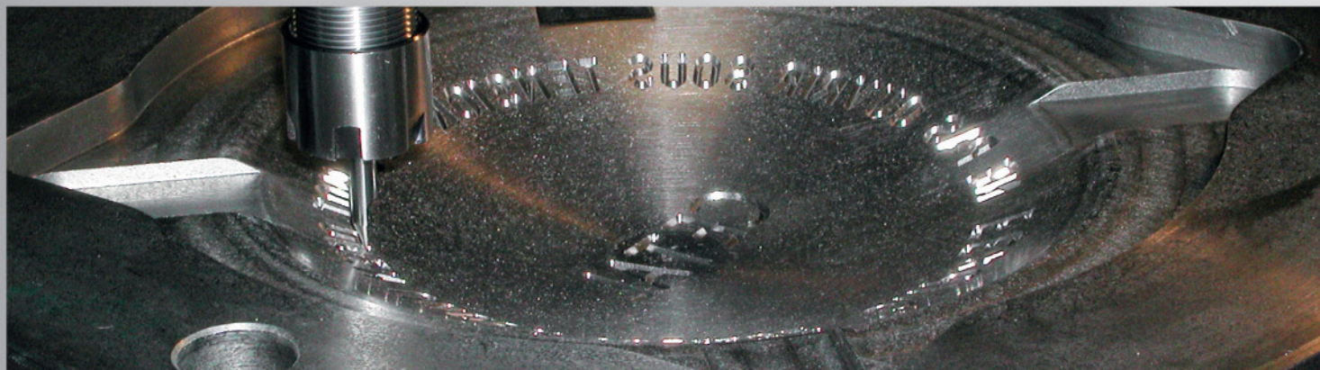
gravure mécanique sur pièce concave

Retrouvez toutes nos réalisations sur notre site: www.kellersign.com