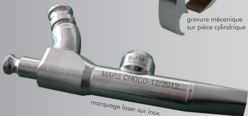
marquage laser sur inox