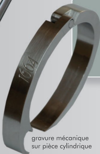
gravure mécanique sur pièce cylindrique

De nature plane, cylindrique, concave, convexe, en métal, en plastique, de matière organique ou minérale, votre surface est notre champ d'action