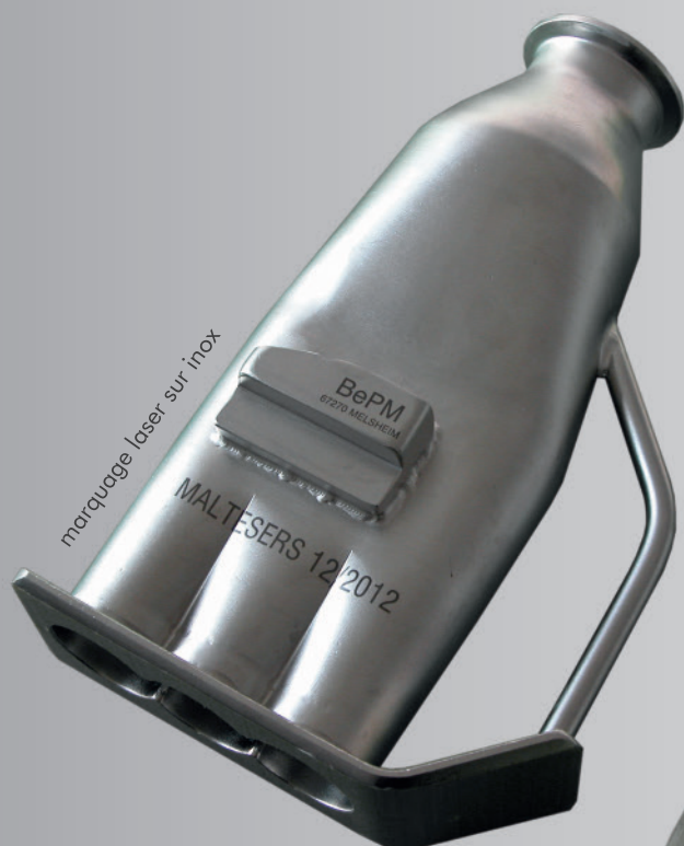
marquage laser sur inox